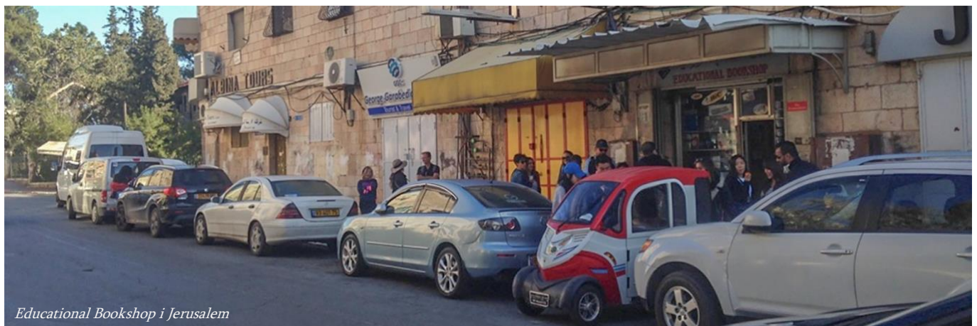
Educational Bookshop i Jerusalem